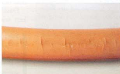
Abb. 7: Rohr-Innenansicht danach