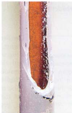
Abb. 5: Zu späte Zustandsanalyse – wenn die Versprödung schon zu offenen Rissen geführt hat, kann keine Neubeschichtung von innen mehr erfolgen.